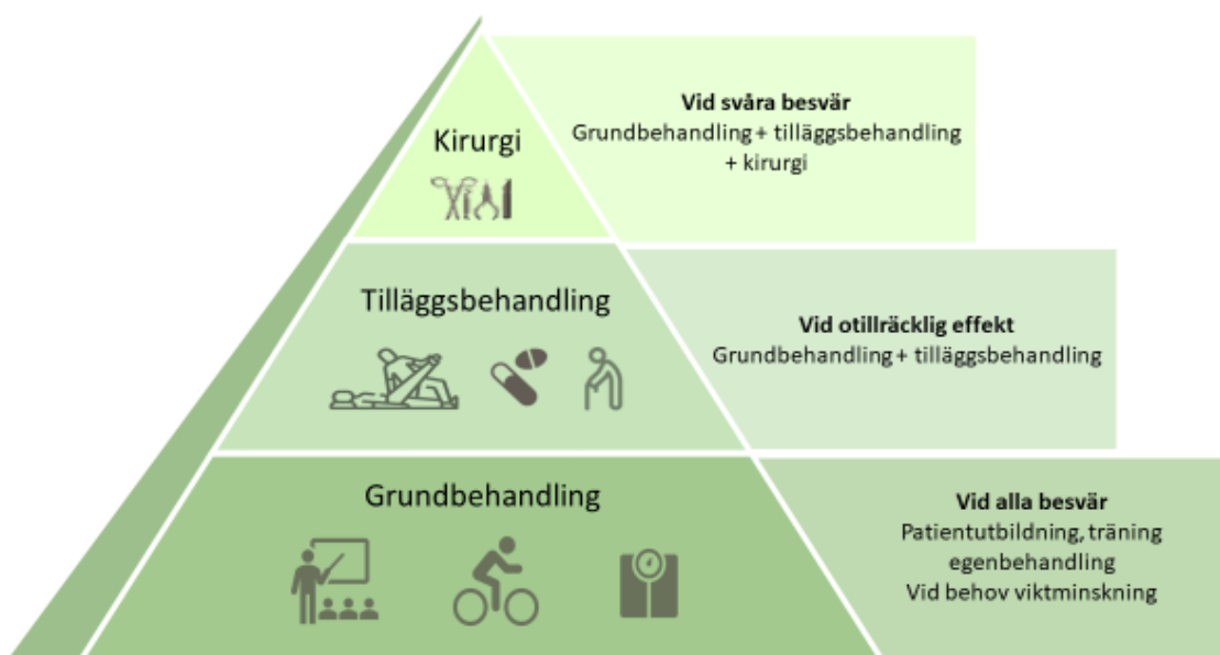
Figur 2. Behandlingspyramid för höftledsartros.

Grundbehandlingen vid höftledsartros utgörs av information, patientutbildning om artros samt strukturerad och individuellt anpassad handledd träning hos fysioterapeut till exempel med styrketräning, konditionsträning och balansträning och vid behov stöd för viktnedgång [10]. Även när höftledsartrosen nått ett skede där operation bedöms nödvändig är träning av stort värde under väntetiden till operation för att minska smärta och risk för viktuppgång. Träning förbättrar även förutsättningar för postoperativ rehabilitering. Väl genomförd grundbehandling kan också förväntas ge samhällsekonomiska vinster till följd av minskad sjukskrivning. Vid behov kan grundbehandlingen kompletteras med tillägsbehandling såsom smärtlindrande läkemedel och hjälpmedel. Hos en mindre andel av patienterna, med svåra besvär och där grund- och tillägsbehandling inte har tillräcklig effekt, kan kirurgisk behandling i form av proteskirurgi bli aktuell. Patientens delaktighet är av största vikt vid både planering och genomförande av de olika delarna i behandlingspyramiden [11].